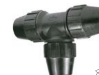
J-73 Tê bocas iguais