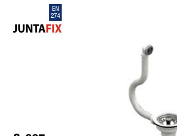
S-337 Válvula cesta com respiro flex, branca aço inox, granito, composto, fibra, etc...