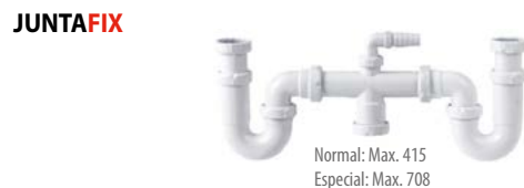
S-30 Sifão curvo duplo, extensível, saída orientável, com porcas e ligação auxiliar