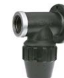
J-72 Curva torneira.