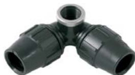
J-90 Curva 90° rosca lateral