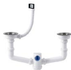
S-472 Sifão duplo, extensível, saída horizontal, válvulas cesta com respiro