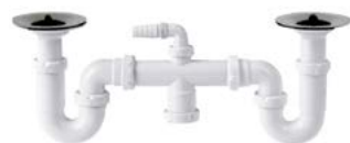
S-233 Sifão curvo duplo, extensível, saída orientável, válvulas e ligação auxiliar