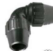
J-64 União curva 90°