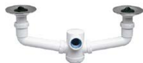
S-232 Sifão duplo, extensível, saída horizontal, válvulas.