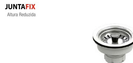
S-236 Válvula cesta branca aço inoxidável, granito, composto, fibra, etc...