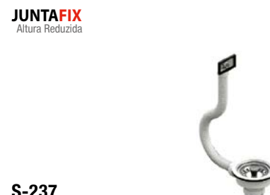
S-237 Válvula cesta com respiro flex, branca aço inox, granito, composto, fibra, etc...