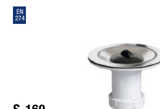
S-160 Válvula branca aço inoxidável