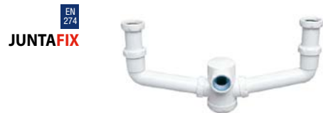
S-7 Sifão duplo, extensível, saída horizontal, com porcas