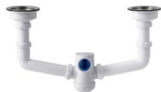
S-473 Sifão duplo, extensível, saída horizontal, válvulas cesta