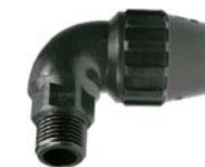
J-69 União curva 90° rosca macho