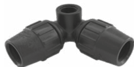
J-90 Curva 90° rosca lateral