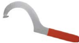
Chave de aperto fitting Gama 55