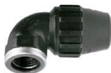
J-71 União curva 90° rosca fêmea