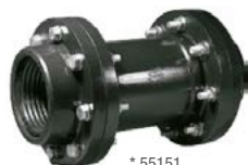
J-63 União reta tipo flange